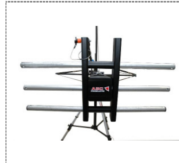
2. Montagebild / Main assembling front picture