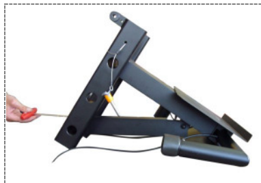
3. Befestigung der unteren Klammer am unteren Steg des Gewichtsträgers / Fastening of the lower bracket at the lower footbridge of the weight carrier