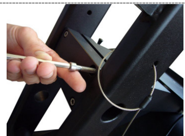
5. Befestigung der oberen Klammer am oberen Steg des Gewichtsträgers / Fastening of the upper bracket at the upper footbridge of the weight carrier