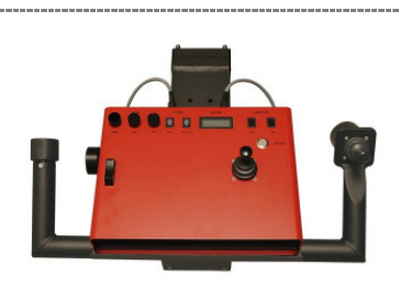
8. Fertiges Montagebild mit Blickrichtung zum Kran / Ready assembly picture with line of sight to the crane

Bitte beachten Sie zudem die Sicherheitshinweise in der Betriebsanleitung!