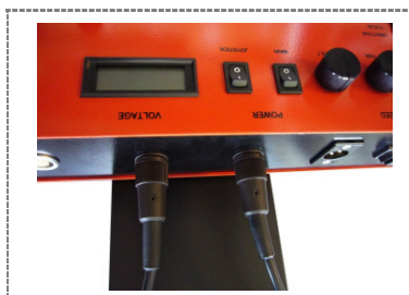
7. Detailbild der Anschlüsse [Hinweis: Wenn die Kabel der Einmannbedienung angeschlossen sind, ist der Joystick am Steuerkasten inaktiv] / Detail picture of the connections [note: if the cables of the one man operation are attached, the joystick is inactive at control panel]