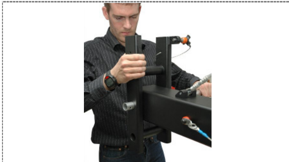
1. Gewichtsträger mit Rohr verbinden (Mittelloch Steckverbindung) / Connect counterweight carrier with the tube (central hole patch cord)