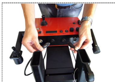
6. Anschließen der Verbindungskabel Einmannbedienung an den Anschlüssen am Steuerkasten / Attaching the interconnecting cables of the one man operation at the connections at the control panel