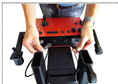
6. Anschließen der Verbindungskabel Einmannbedienung an den Anschlüssen am Steuerkasten / Attaching the interconnecting cables of the one man operation at the connections at the control panel